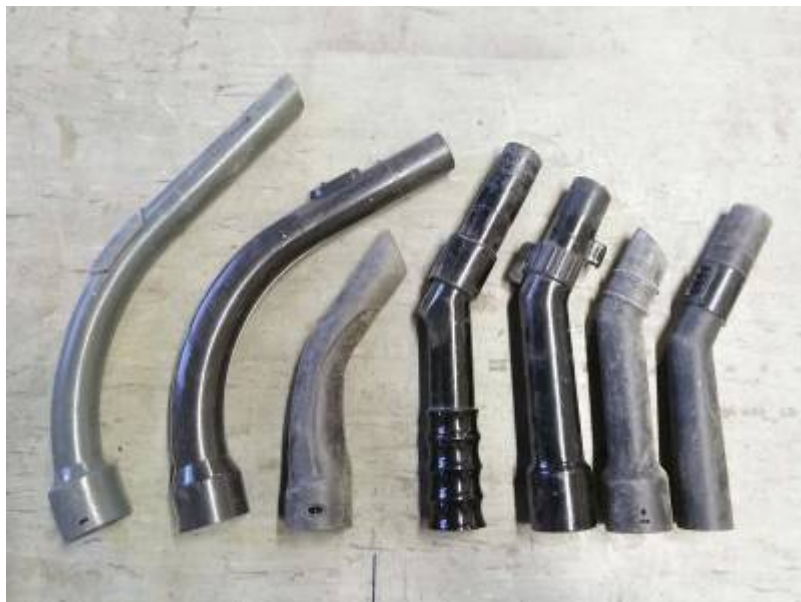
First slide label

Nulla vitae elit libero, a pharetra augue mollis interdum.