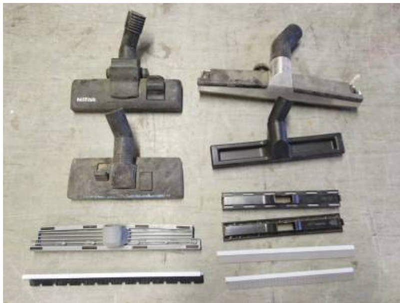
First slide label

Nulla vitae elit libero, a pharetra augue mollis interdum.