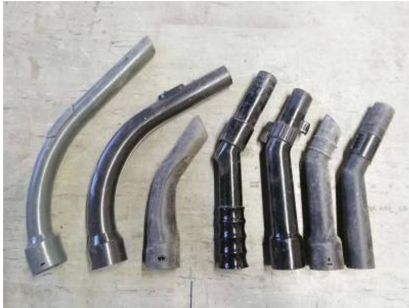
First slide label

Nulla vitae elit libero, a pharetra augue mollis interdum.